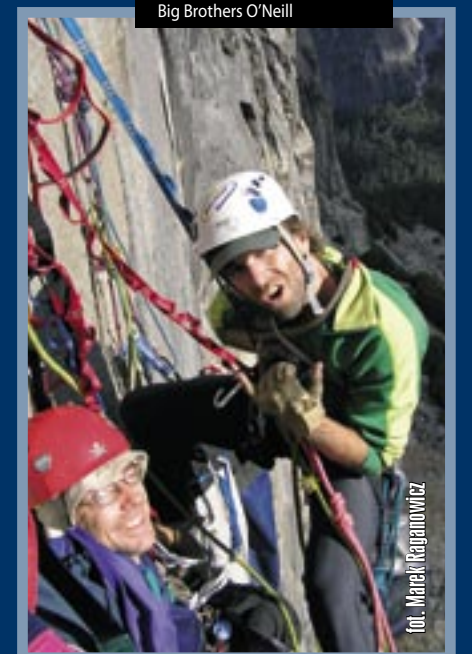
Big Brothers O'Neill